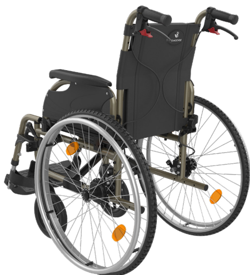
ICON 20 wersja z hamulcami bębnowymi dla osoby prowadzącej.

Icon 20 to lekki, aluminiowy, składany wózek inwalidzki, który został zaprojektowany tak, aby umożliwić użytkownikowi samodzielne poruszanie się.